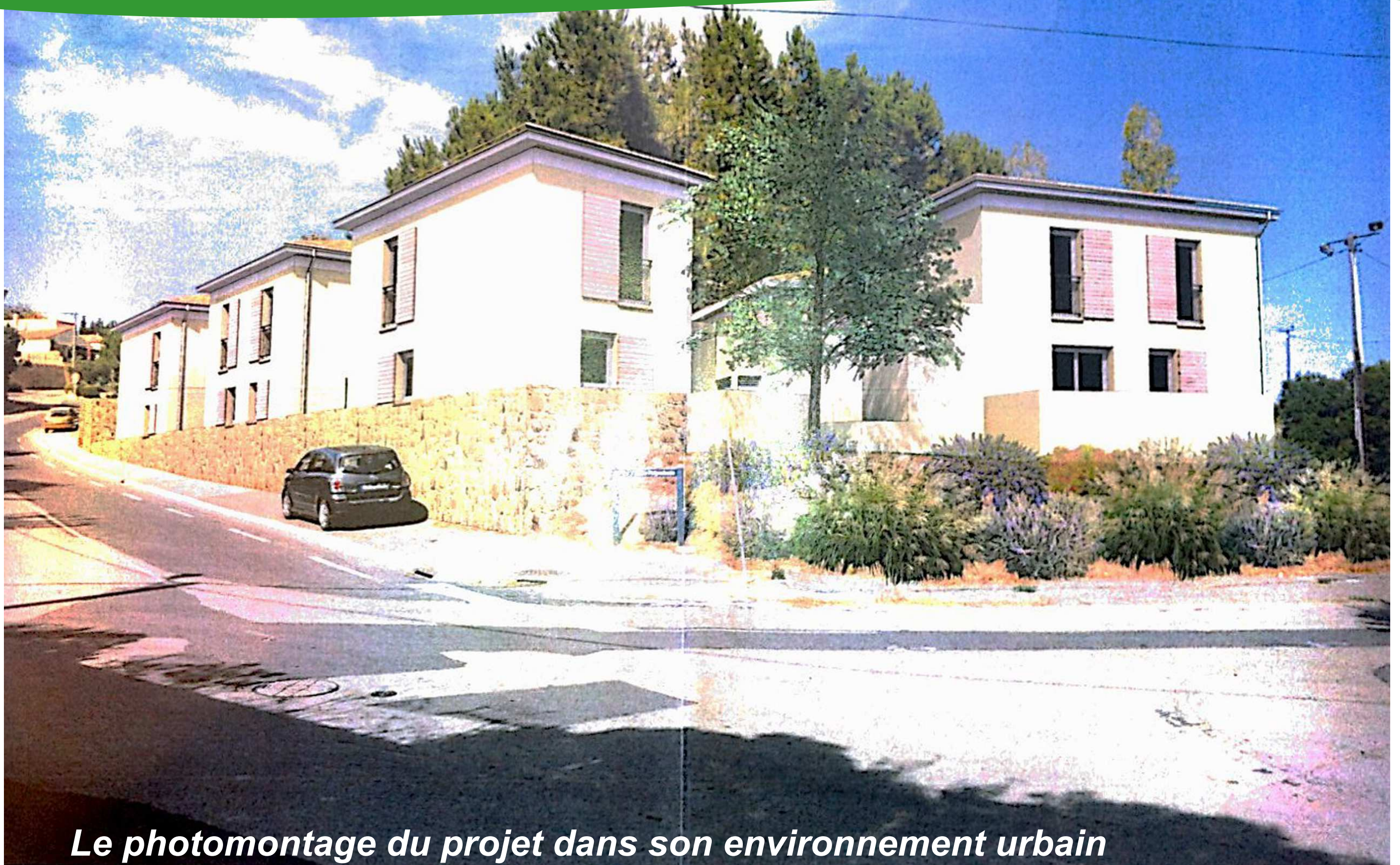
Le photomontage du projet dans son environnement urbain